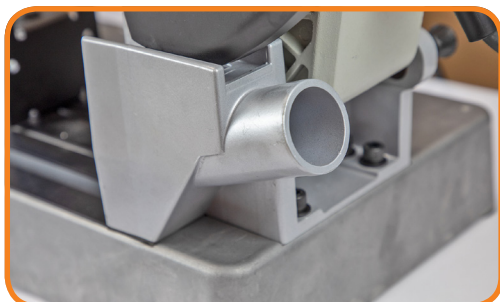
Udtag til støvsugerslange