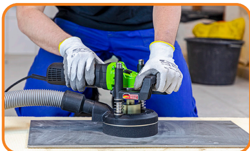
Udtag til støvsugerslange