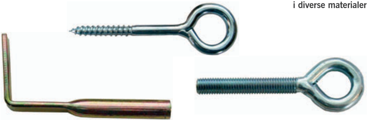
Expandet Øje-/Stilladsskrue med trægevind

Til opsætning af stilladser med mere i diverse materialer