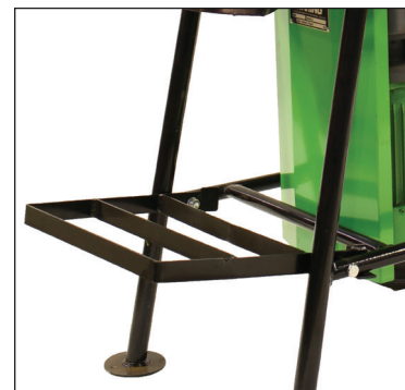
Stativ til spand