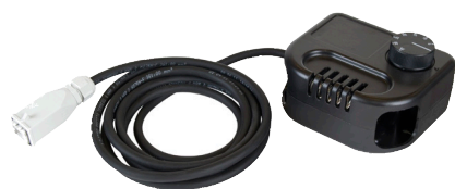
Mulighed for tilkøb af rumtermostat