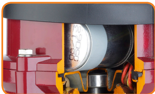
Indbygget motor beskyttelse