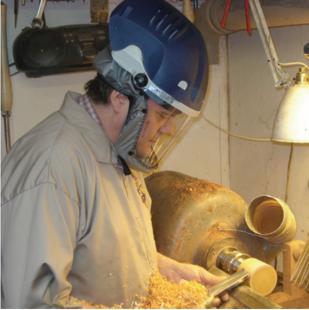
Træbearbejdning og -behandling – beskytter mod støv, flyvende partikler og stænk fra træbeskyttelsesmidler