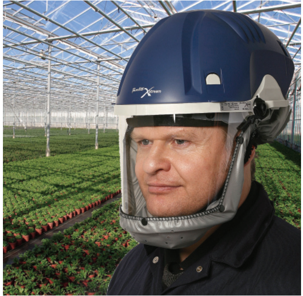
Landbrugsområdet – beskyttelse ved spredning af kunstgødning, skadedyrsbekæmpelse, høst og pakkearbejde

Den nye Purelite Xstream er et uafhængigt, letvægts turbodrevet åndedrætsværn, som yder fuld åndedrætsbeskyttelse mod støv, røg og partikler, kombineret med øjen- og ansigtsbeskyttelse mod flyvende partikler samt stænk og sprøjt.