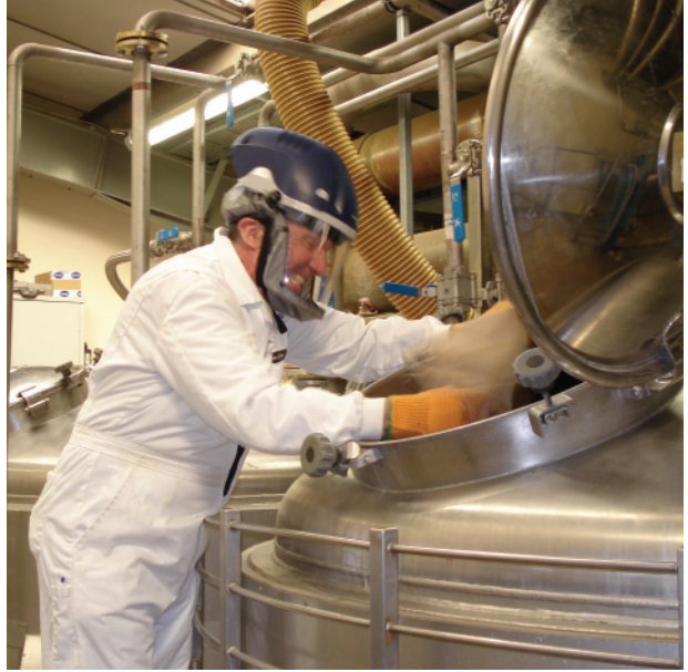
Fødevarerproduktion – beskyttelse mod indånding af støv og partikler samt stænk og sprøjt