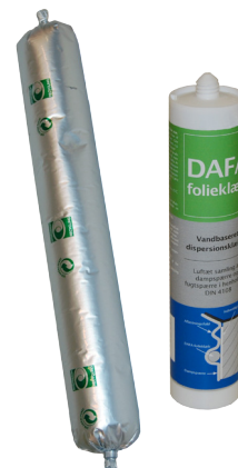
DAFA folieklæb i 580 ml alu foliepose og 310 ml tube.