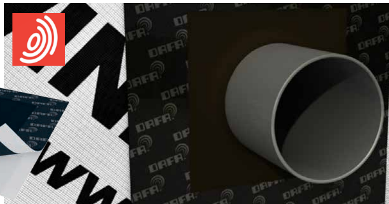
DAFA UV rørkrave, en patenteret løsning.