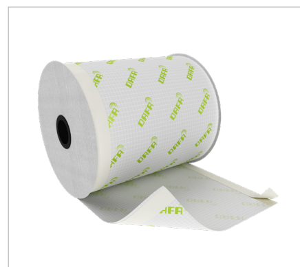
DAFA ExFoil lysningsfolie med hhv. 2 x dobbelt klæb og med dobbelt klæb og butyl.