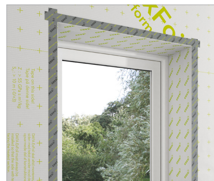
DAFA ExFoil lysningsfolie er CE-mærket efter EU-standard EN 13984.