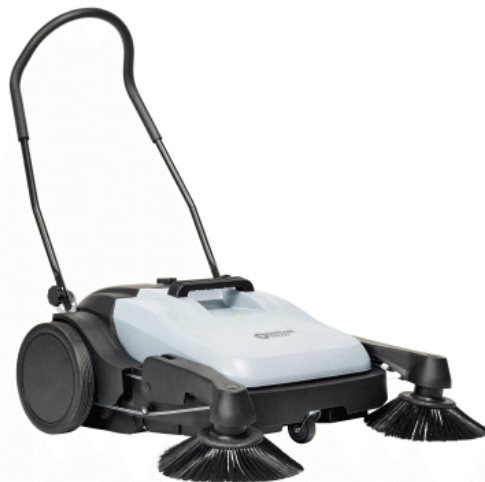
Billedet kan variere fra den valgte model

Den hurtige og produktive Nilfisk fejmaskine er ideel til rengøring i mindre fabrikker, parkeringsanlæg, indkøbscentre, skoler, værksteder, bus- og togstationer og udendørs arealer ved kontorbygninger.